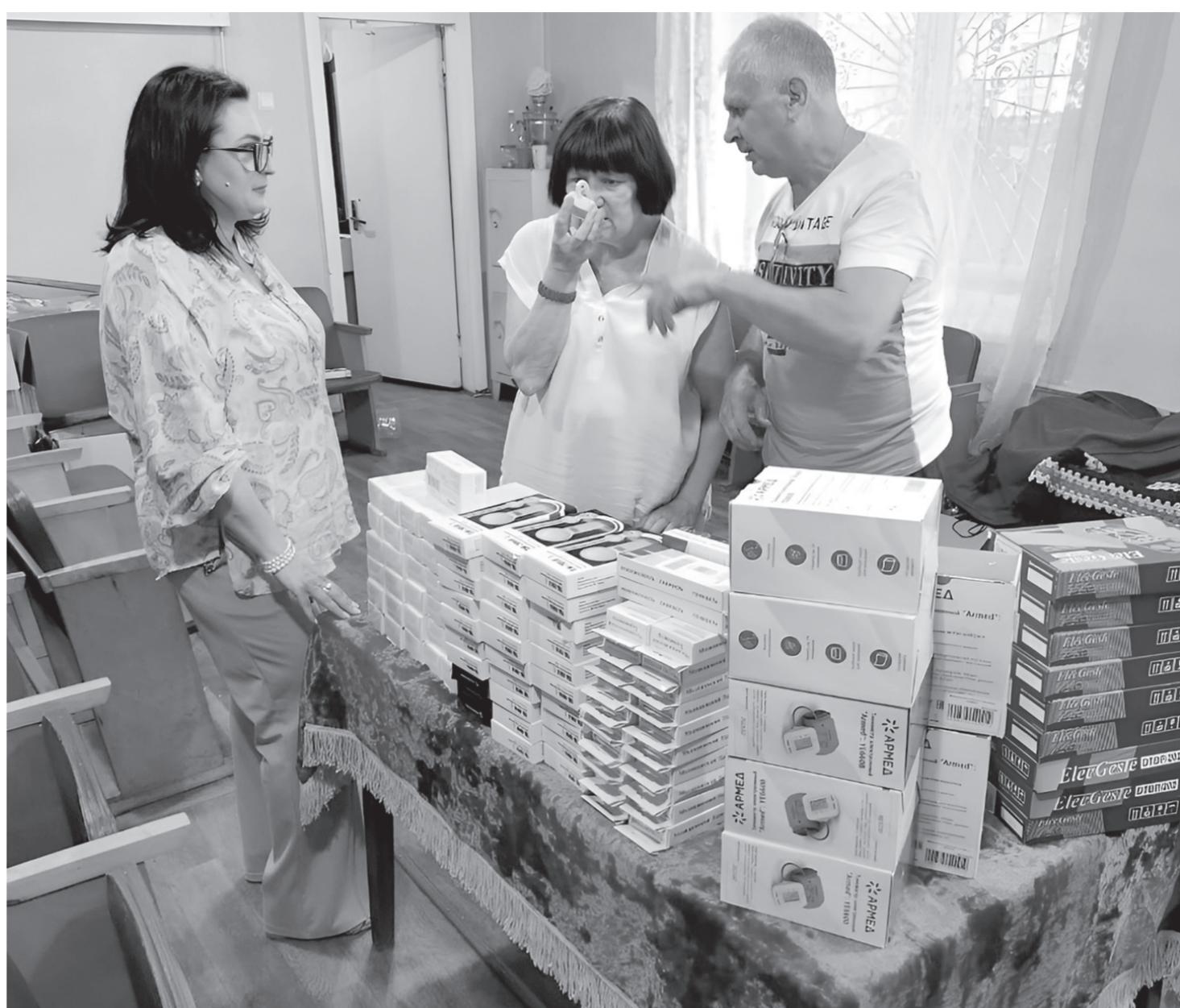
Сотрудники Центра социального обслуживания населения передали гуманитарный груз своим подшефным в ЛНР