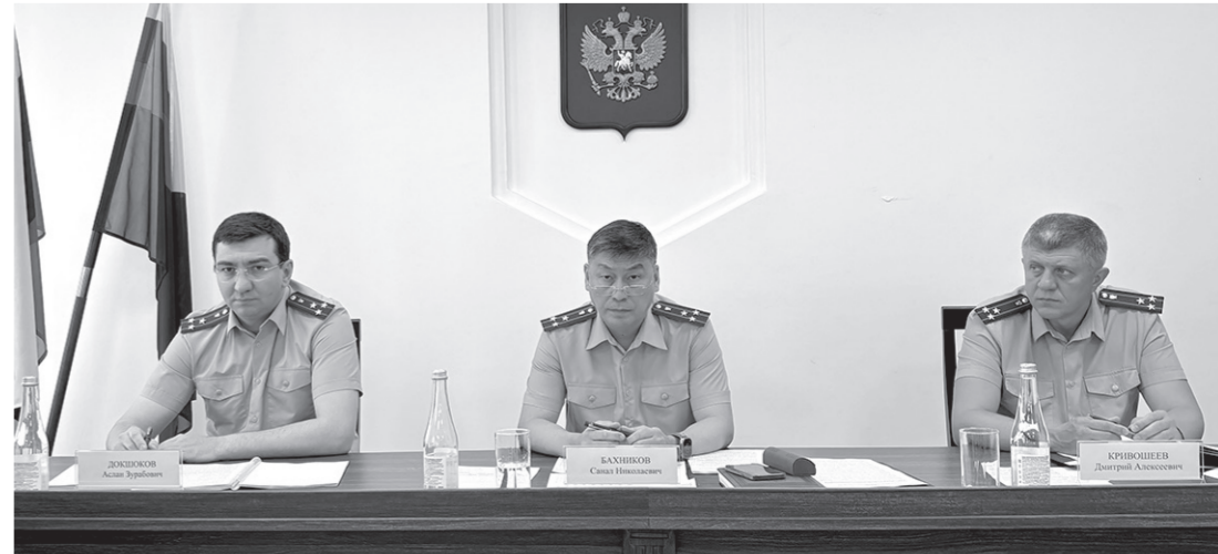
На коллегии подвели итоги работы ведомства за первое полугодие