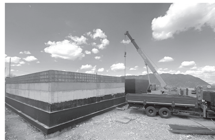
Идет строительство напорно-регулирующих резервуаров питьевой воды в Адыге-Хабле

На территории станции Сторожевой Зеленчукского района то-