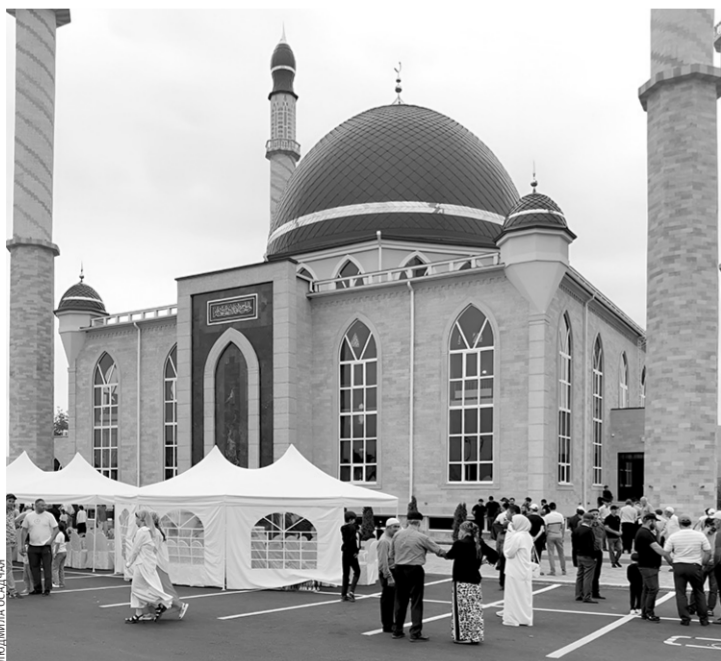
Мечеть в Зеленчукской впечатляет своей архитектурой